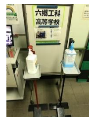
足踏み消毒スタンド