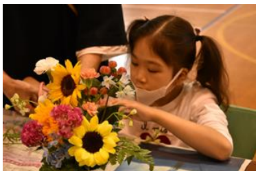
小学部 フラワーアレンジメント体験

高等部卒業後、自分はどのように過ごしていきたいか。見学や体験を通して、より現実的に考えます。生徒本人と保護者の方との相談に基づき、一人一人の希望進路実現に向けた取り組みを行います。社会に出ることを意識し、「地域でどう過ごしていきたいか」について考え、親子でイメージする機会をつくっていきます。